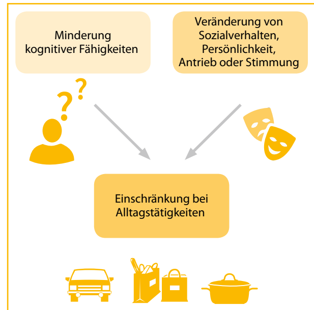
Abb. 2: Merkmale der Demenz

al, 2019). Diese Wesens- und Verhaltensänderungen bedingen sich häufig durch den Verlust der gewohnten (kognitiven) Alltagsfähigkeiten. Denn dieser Verlust führt bei vielen Betroffenen zu Verunsicherung und Frustration. Sie reagieren oftmals aggressiv, vermeiden aus Scham soziale Kontakte und ziehen sich aus dem gesellschaftlichen Leben zurück. Dies betrifft auch die Teilnahme an Sportgruppen.